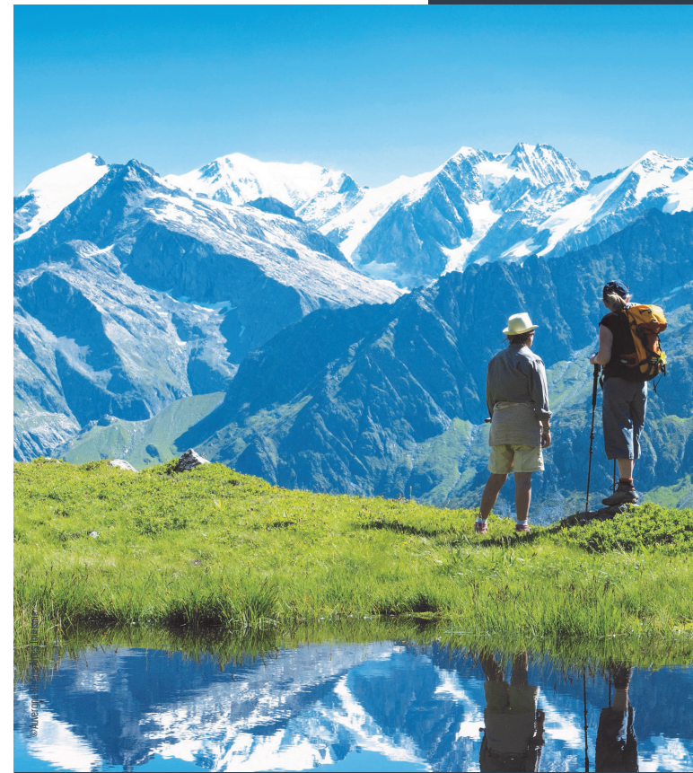
Les Cars de la Région Auvergne-Rhône-Alpes